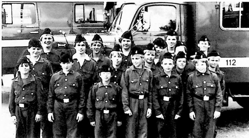
"Schnell, ein Foto, es regnet gerade nicht !!"